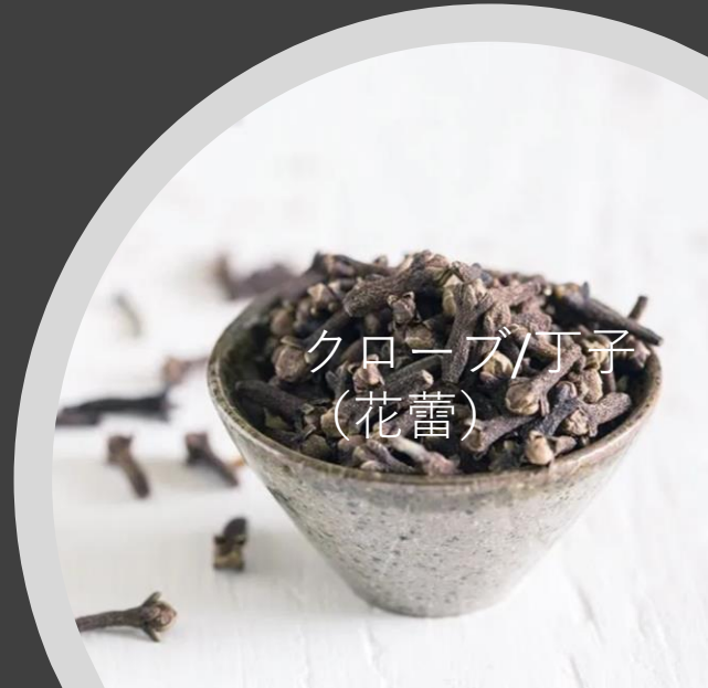
クローブ/丁子 (花蕾)

Happier Dec 19, 2021/