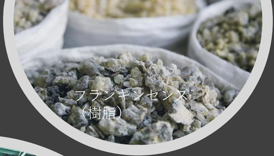
フランキンセンス (樹脂)